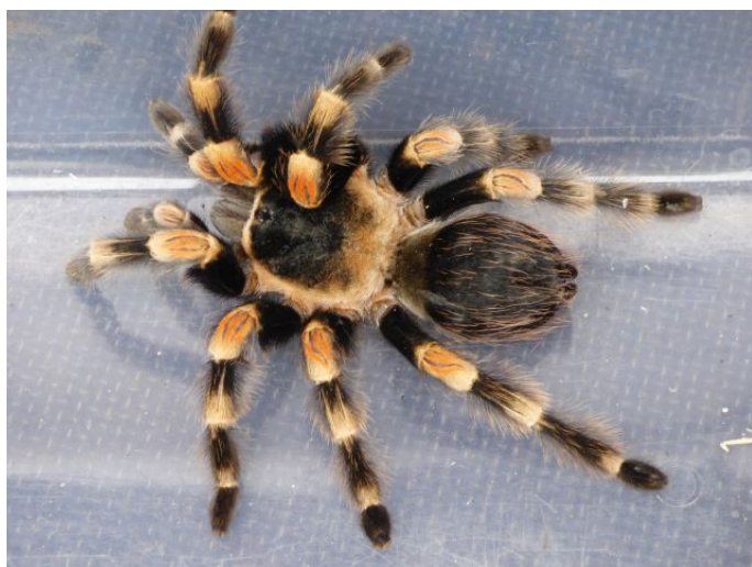
Ilustracja 2: Pająk ptasznik czerwonokolanowy

W dniu 21 czerwca około godz. 12.30 dyżurny Straży Miejskiej otrzymał zgłoszenie o dużym i prawdopodobnie groźnym pająku na trawniku w pobliżu bloku przy ul. Krańcowej. Na miejsce niezwłocznie udali się funkcjonariusze Eko-patrolu Straży Miejskiej. Pająk został odłowiony i przewieziony do schroniska dla zwierząt.