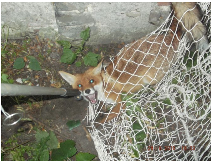
Ilustracja 1: Lis przy ul. Żmigród

W dniu 29 czerwca około godz. 17.30 dyżurny Straży Miejskiej otrzymał zgłoszenie, że przy ul. Żmigród na terenie szkoły lis podchodzi do dzieci. Patrol Straży Miejskiej niezwłocznie udał się na miejsce; wezwano również lekarza weterynarii z Lubelskiego Centrum Małych Zwierząt. Lis został odłowiony około godz. 18.30 i przewieziony do kliniki dla zwierząt przy ul. Stefczyka.