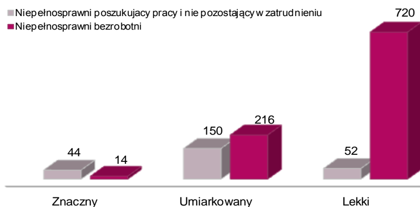
Wykres 3. Osoby niepełnosprawne według stopnia niepełnosprawności w 2011r.