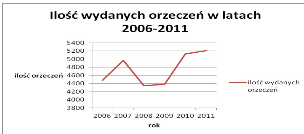
Wykres 2. Liczba wydanych orzeczeń w latach 2006 – 2011.